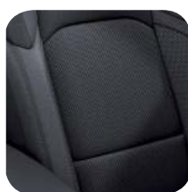
TAPICERKA MATERIAŁOWA BLACK