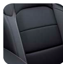
TAPICERKA SKÓRZANA BLACK