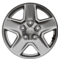
Aluminiowe obręcze kół 17" TECH SILVER