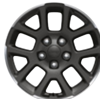
Aluminiowe obręcze kół 18" GRANITE CRYSTAL