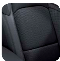
TAPICERKA MATERIAŁOWA BLACK SPORT