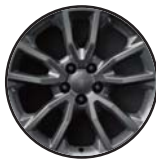
1M6 Aluminiowe felgi 18"x 7,5" opony letnie 235/55R18 (klasa B)