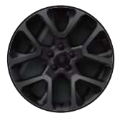
1M1 Aluminiowe felgi 19"x 7,5 opony letnie 235/45R19 (klasa B)