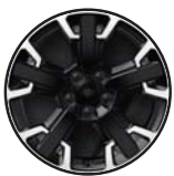
1M4 Aluminiowe felgi 17" opony Mud+Snow W 235/60 R17 (klasa B)