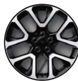
1M8 Aluminiowe felgi 19"x 7,5 Diamond opony letnie 235/45R19 (klasa B)