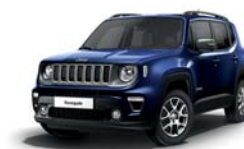
888 Niebieski Jetset (metalizowany)