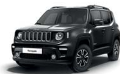
095 Grafitowy Granite Crystal (metalizowany)