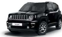
876 Czarny Carbon (metalizowany)