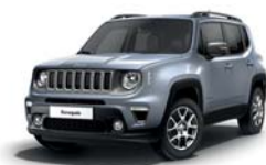
348 Srebrny Glacier (metalizowany)