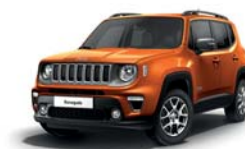
562 Pomarańczowy Omaha (pastelowy)