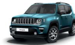
470 Bikini (metalizowany)