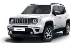
296 Biały Alpine (pastelowy)