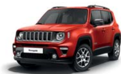
176 Czerwony Colorado (pastelowy)